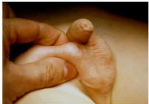
Esempio di criptorchidia destra: emiscroto destro vuoto all'osservazione diretta (sinistra); il testicolo si palpa a livello inguinale e non lo si riesce a trascinare fino alla borsa scrotale (a destra)